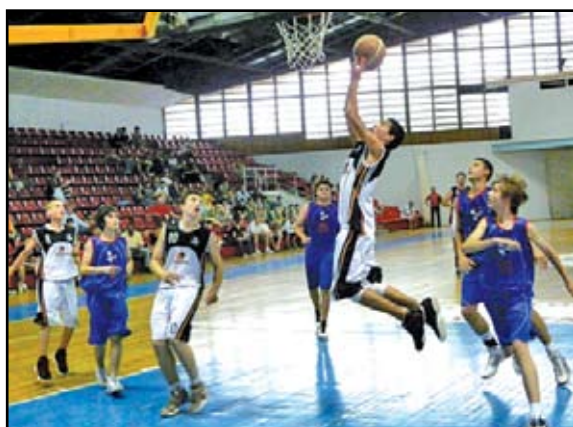
Атрактивните отигравания бяха патент на „белите“ баскетболисти в мачовете във финалния турнир