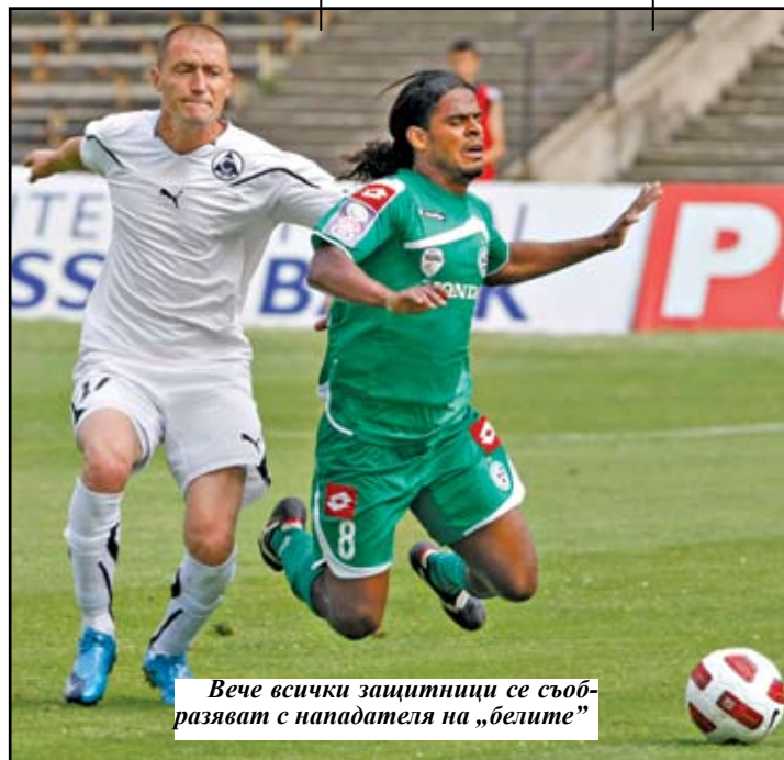
Вече всички защитници се съобразяват с нападателя на „белите“