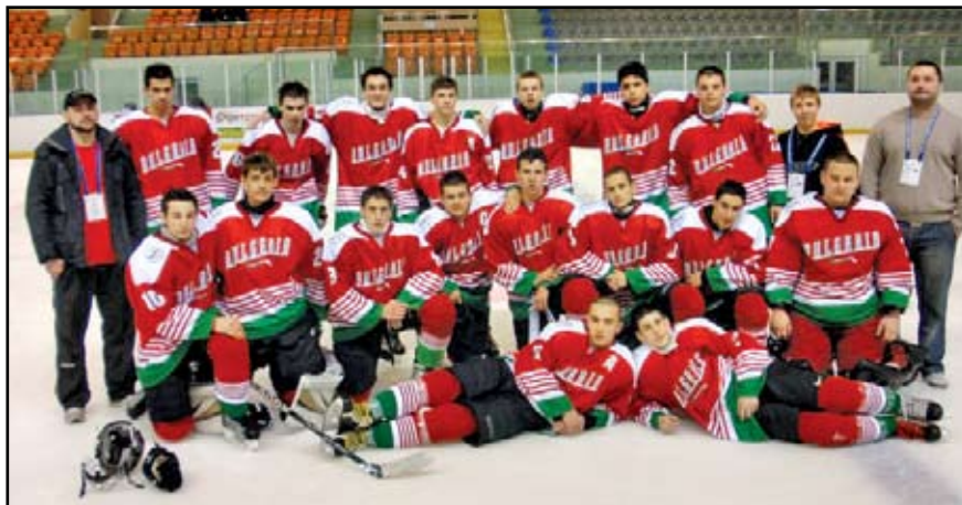
Младежките формации по хокей на лед са сред основните приоритети на родната хокейна централа

- Има ли някакви новини около хокейния отбор на „Славия“?