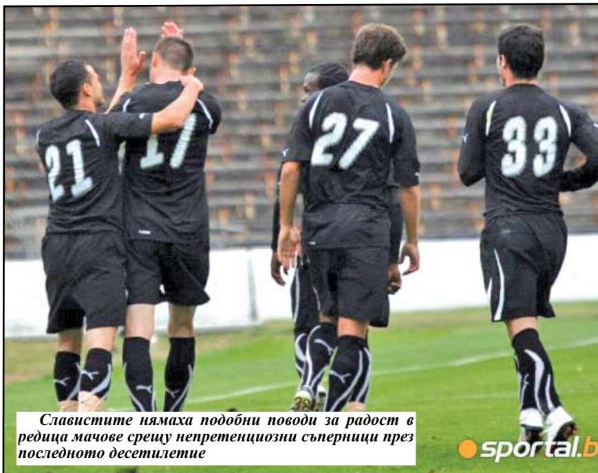
Славистите нямаха подобни поводи за радост в редица мачове срещу непретенциозни съперници през последното десетилетие

неоспоримите аутсайдери в майсторската група. Няколко месеца по-късно последва нова домакинска издънка от „Велбъжд”, този път с 0:2.